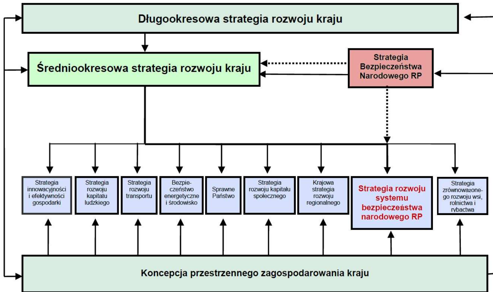
Rysunek 1. Miejsce Strategii rozwoju systemu bezpieczeństwa narodowego RP w hierarchii dokumentów strategicznych