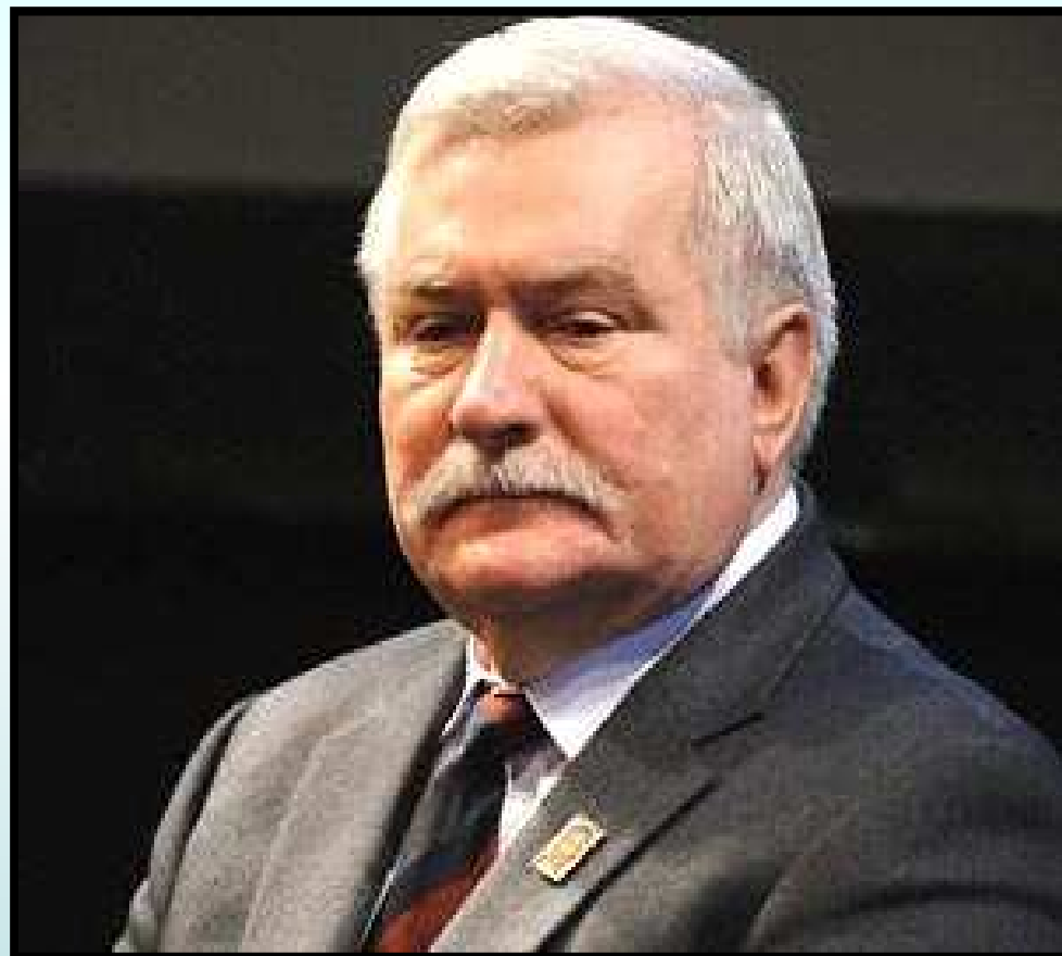
Lech Wałęsa, Prezydent RP w latach 1990-1995

Polityka bezpieczeństwa i strategia obronna Rzeczypospolitej Polskiej była dokumentem rozwijającym i precyzującym te zasady. Przedstawiała zamierzenia i kierunki działań mających na celu umocnienie suwerenności i bezpieczeństwa Polski, sprzyjających rozwojowi cywilizacyjnemu naszego kraju i wzrostowi jego pozycji w Europie."